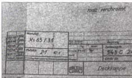
Diese technische Zeichnung zur mattverchromten Deckkappe vom 9.11.1945 belegt den frühen Neubeginn der Konstruktionsarbeiten zur Carl Zeiss Jena-Contax bei Carl Zeiss und Zeiss Ikon.

zur russischen Contax-Produktion und der dazugehörigen Optik- und Zubehörproduktion in Höhe von RM 18.590.000,- übermittelt. Hinzu kommen weitere Kosten für Verpackung der Maschinen und Montage- und Aufbaukosten vor Ort in Russland.